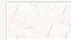
スパニッシュ仕上げ